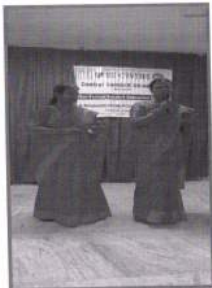
About NFSE Centre during Induction Programme