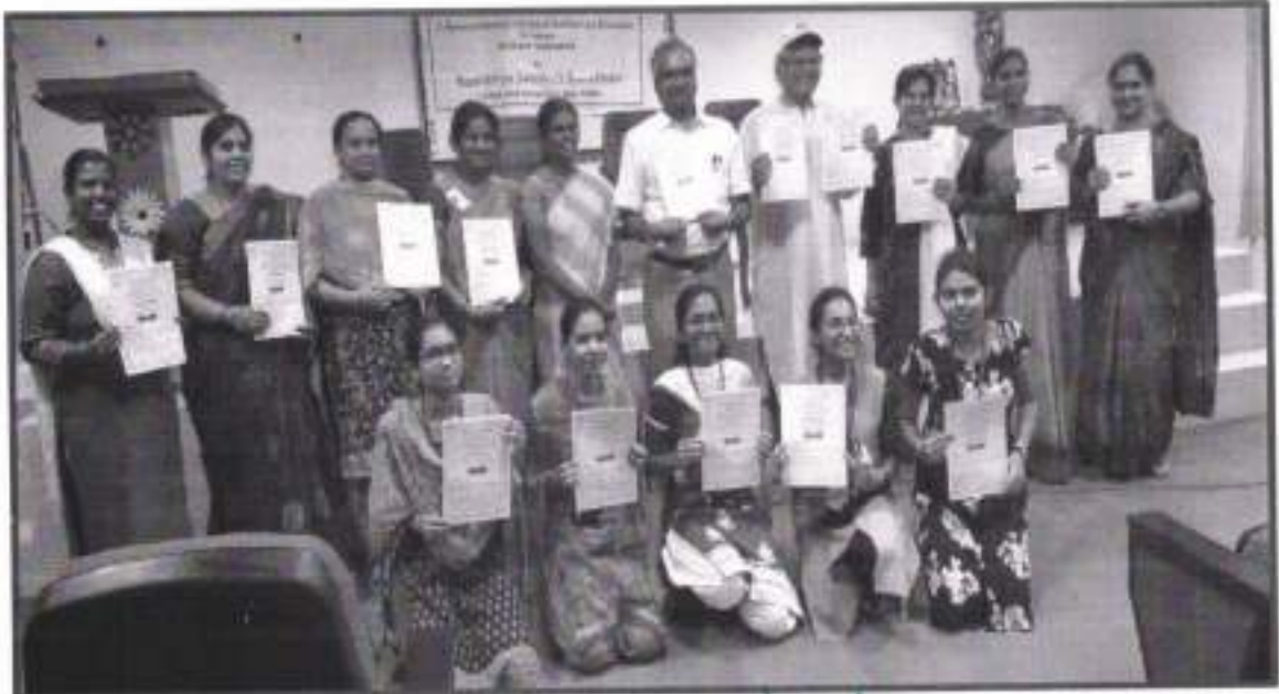
Students receiving the Certificates